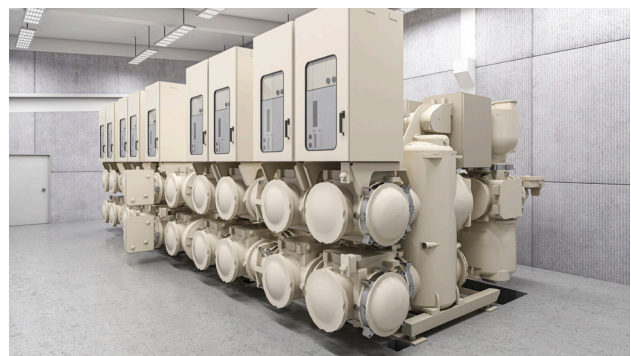
Gasisolierte Schaltanlage 8DN8

den technischen Kundenvorgaben und den örtlichen Gegebenheiten gerecht zu werden: vorhandene Systeme (Trafoanlagen, Hochspannungsleitungen etc.), nationales Recht, Umweltauflagen, Klima oder ein mögliches Erdbebenrisiko. Ergänzend bietet Siemens Energy Services an, wie Transport, Montage, Inbetriebnahme der Schaltanlagen oder Trainings für die Betreiber. So werden schlüsselfertige Umspannwerke von der Planung, über die Produktion und Lieferung bis zur Inbetriebnahme errichtet.