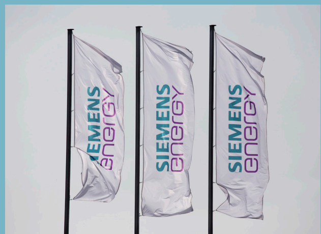
Siemens Energy Flags, Quelle: Siemens Energy